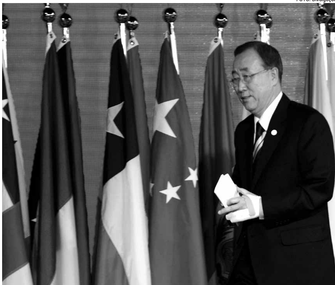
O secretário-geral da ONU, Ban Ki-moon, considerou um fato histórico a aprovação de tratado

Ao final do programa, Dilma fez uma homenagem aos militares brasileiros mortos no último domingo em um acidente rodoviário quando voltavam de uma missão da Operação Ágata no Chuí (RS). "Quero me solidarizar com as famílias desses militares, com os seus companheiros e com o Exército Brasileiro. Quero também fazer votos para que os feridos no acidente tenham a mais rápida recuperação."