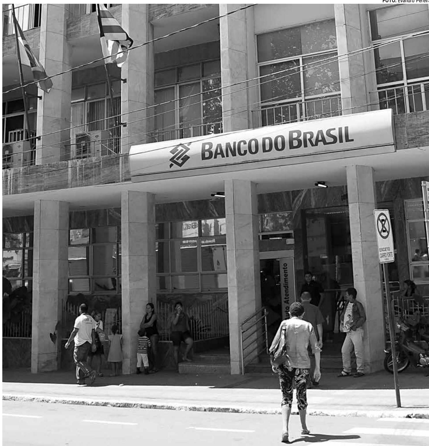
As declarações foram enviadas pela internet ou entregues em disquetes nas agências da Caixa Econômica Federal e do Banco do Brasil