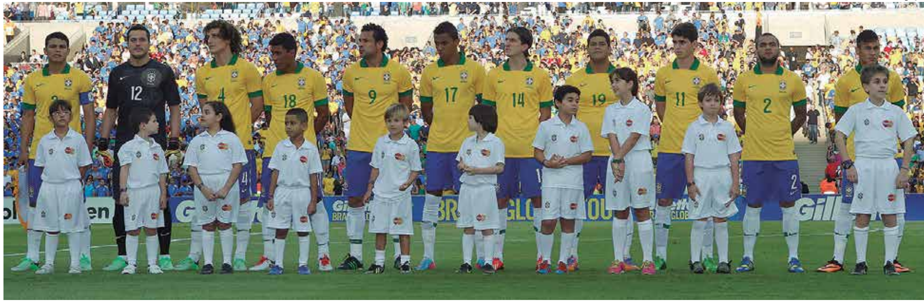
No último domingo, no Estádio do Maracanã, no Rio de Janeiro, a Seleção Brasileira não passou de um empate de 2 a 2 com a Inglaterra irritando Luis Felipe Scolari