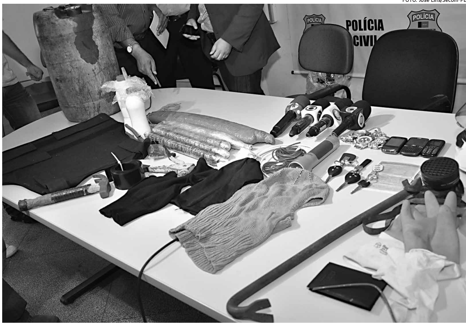
Entre o material apreendido estavam bananas de dinamites, pé-de-cabra, martelo, coletes balísticos, colas, tocas e lanternas

A estimativa é que a quadrilha já tenha lucrado mais de R$ 1 milhão nos assaltos praticados