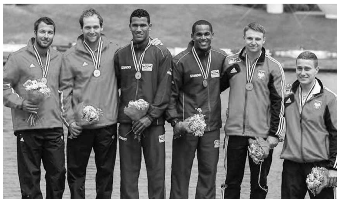
Os representantes do Brasil ganharam duas medalhas de ouro e outras duas de prata na Polônia

A outra medalha de prata da dupla brasileira foi na prova da C2 500m, com o tempo de 1:48.944. A medalha de ouro ficou com os russos Alexey Korovashkov e Ilya Pervukhin, com 1:47.476. O bronze ficou com a dupla polonesa formada por Tomasz Kaczor e Vincent Slominski com 1:49.564.