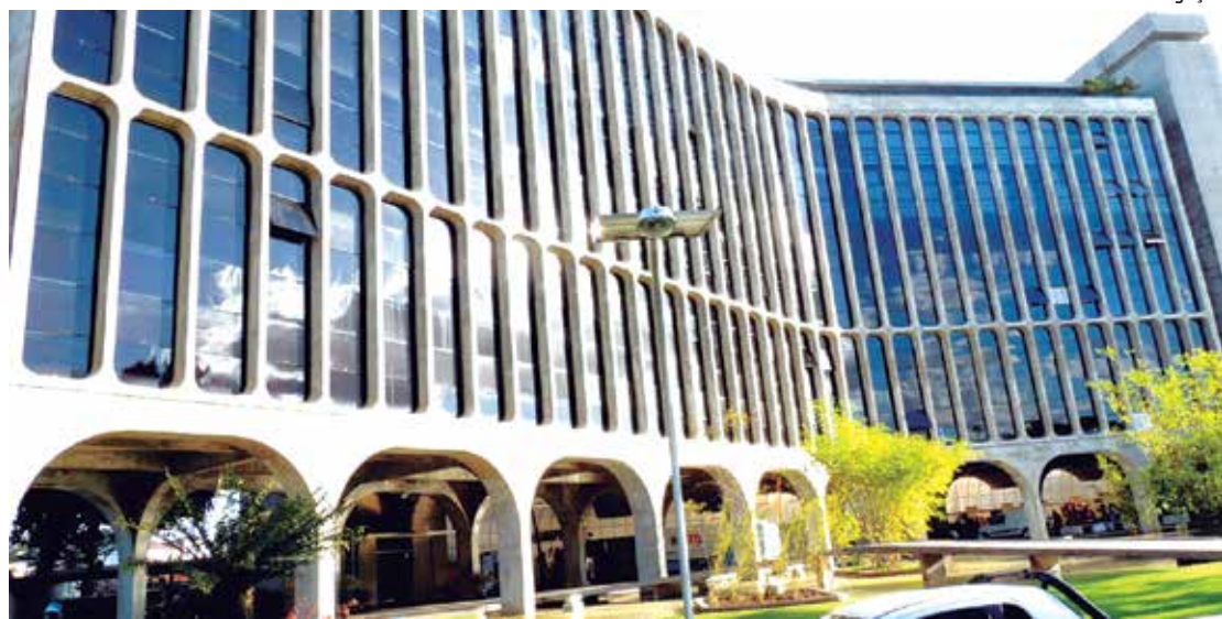
Foto: Divulgação Federação das Indústrias do Estado da Paraíba - Fiep -, onde acontecerá o encontro calçadista

O objetivo do encontro é promover a capacitação, facilitar a venda de produtos e permitir a incorporação de tecnologias à produção dos empresários paraibanos. Com toda a região e o país de olhos voltados para a Paraíba, a projeção da organização do Gira Calçados é de que circulem aproximadamente 2 mil empresários e representantes de empresas nas instalações do evento, e de que sejam fechados negócios da ordem de R$ 8 milhões em até seis meses posteriores ao evento.