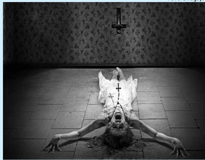
Terror continua em cartaz nos cinemas pessoais