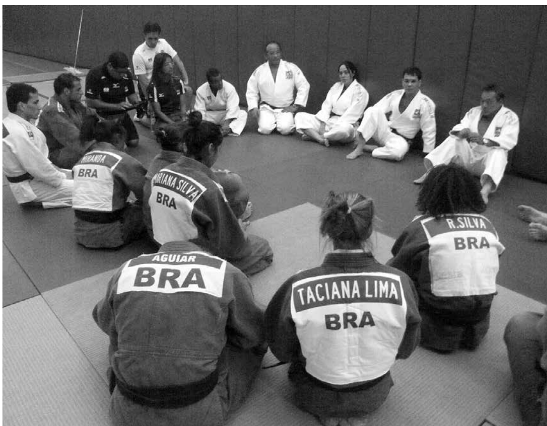
Judocas brasileiros começam a ser preparados para os Jogos Olímpicos com suporte multidisciplinar

A geração do judô brasileiro para os Jogos Olímpicos de 2020 já se prepara. Com um conjunto de ações, os judocas brasileiros com idade entre 15 e 19 anos conta com suporte multidisciplinar e a oportunidade de ganhar experiência internacional, em intercâmbios e competições. “Estamos pensando em 2020. Claro que alguns dos judocas que estão hoje na base, no Sub-21, por exemplo, poderão disputar os Jogos Rio 2016, principalmente no feminino.