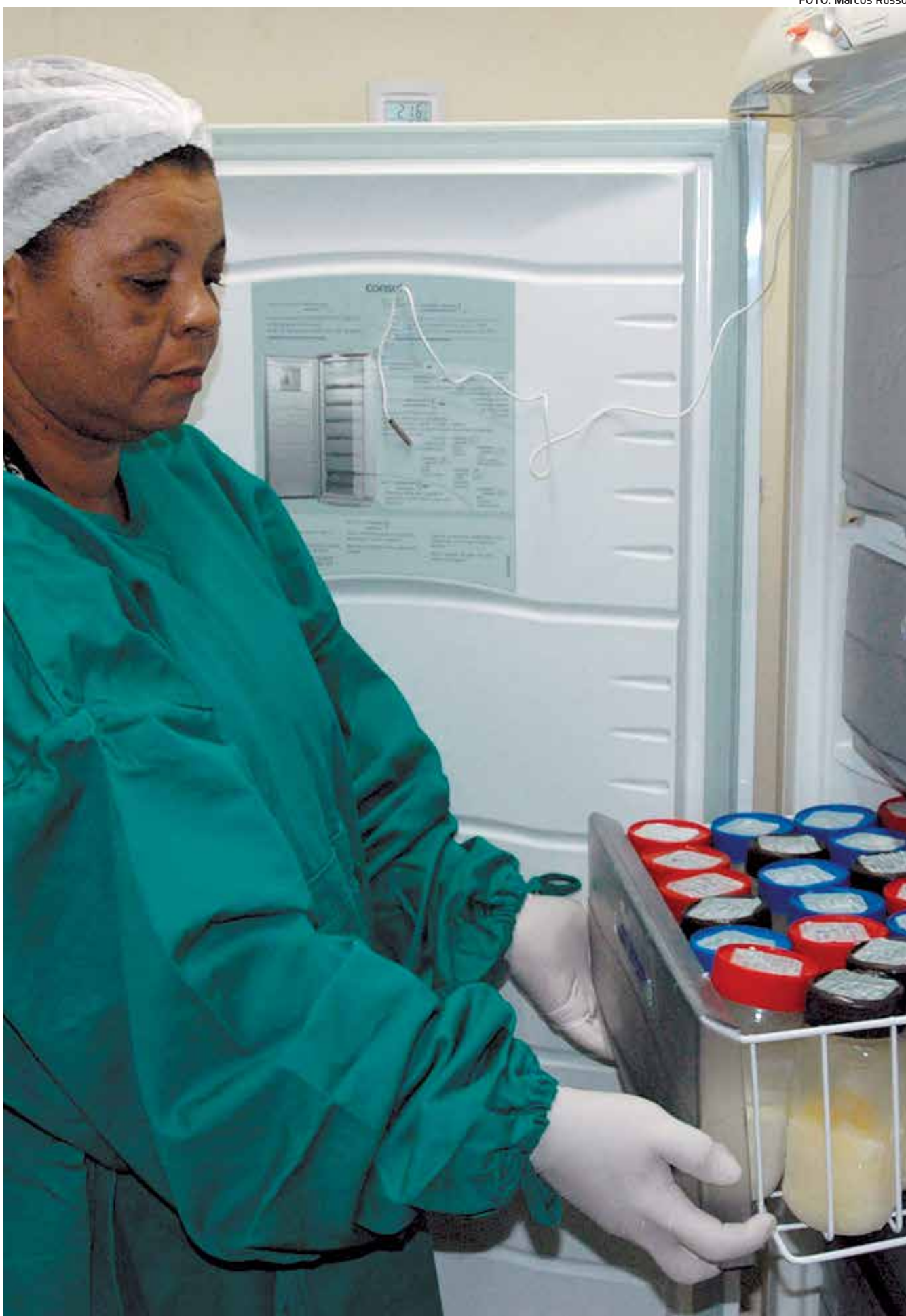
A Paraíba é o Estado do Nordeste com maior número de unidades da Rede Brasileira de Bancos de Leite Humano

Os frascos de vidro usados na coleta e distribuição do leite materno são item fundamental no processo. Os bancos de leite e postos de distribuição precisam desses recipientes (vidros de maionese ou café solúvel, com tampa rosqueável de plástico), por isso também recebem doações desse material, bastando ligar para o número 3215.6047.